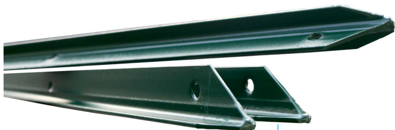
Sezione Ferro a T

N.B. : La 'Euro Reti srl' si riserva di apportare variazioni senza alcun preavviso .